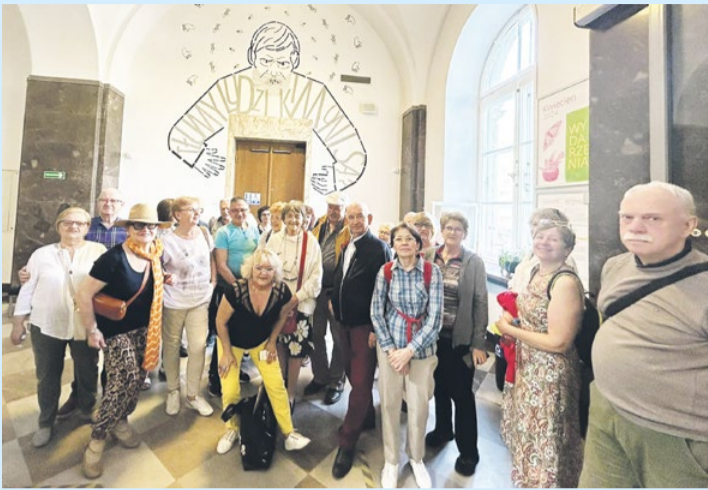
W wtorek 9 kwietnia słuchacze Legionowskiego Uniwersytetu Trzeciego Wieku odwiedzili wystawę prac Gustava Klimta i Muzeum Etnograficzne.