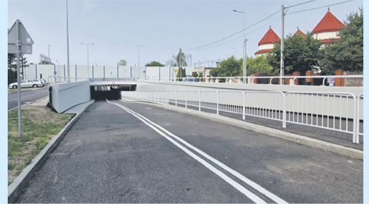
Tunel na Bukowcu

• zakup nowego lekkiego samochodu ratowniczo gaśniczego za kwotę 330 000 zł na potrzeby Ochotniczej Straży Pożarnej.