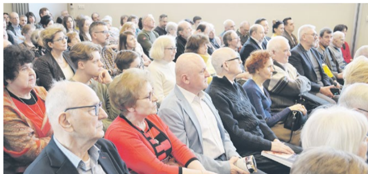
Goście podczas prezentacji XV tomu rocznika w Muzeum Historycznym, 25 lutego 2024 r.

„Rocznik Legionowski” to czasopismo wydawane przez Towarzystwo Przyjaciół Legionowa od 20 lat. Na jego łamach publikowane są artykuły dotyczące historii Legionowa i powiatu legionowskiego. Za każdym razem uroczyste prezentacje pisma gromadzą wielu miłośników lokalnej historii. Nie inaczej było 25 lutego br. podczas promocji jubileuszowego XV tomu w Muzeum Historycznym.