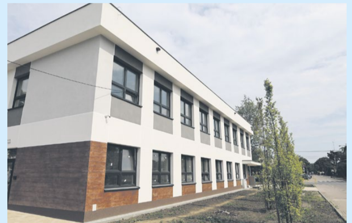
Ośrodek Pomocy Społecznej