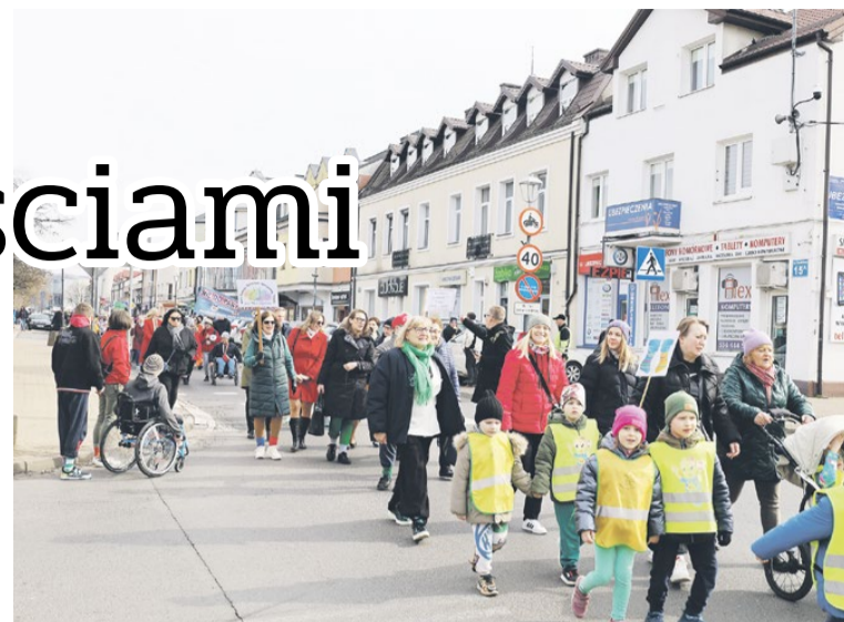
Marsz Kolorowej Skarpetki 2024 będący integralną częścią XIII Dni

szacunku i akceptacji. Towarzyszyły im tablice z hasłami o tolerancji, a większość uczestników eksponowała kolorowe skarpetki. Po prawie godzinie marszu uczestnicy dotarli pod budynek Urzędu Miasta Legionowo, gdzie odbyło się oficjalne zakończenie wydarzenia. Tam miały miejsce przemówienia lokalnych liderów społeczności oraz przedstawicieli organizacji zajmujących się sprawami osób z niepełnosprawnościami.